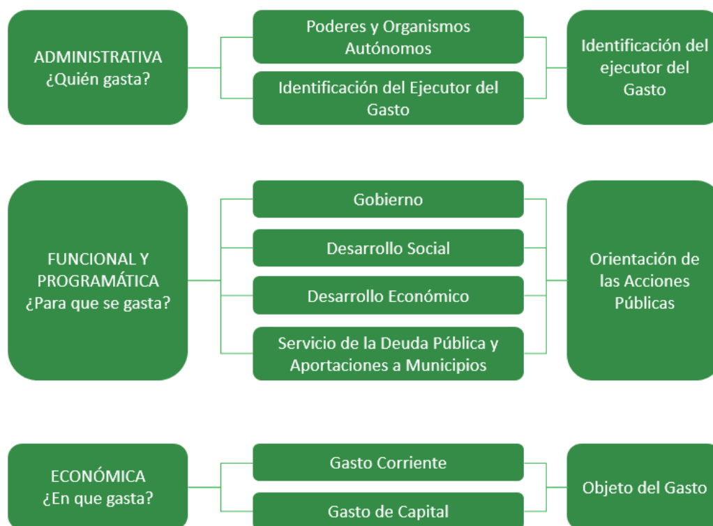
DIAGRAMA 1. DIMENSIONES DEL GASTO

Durante el proceso de presupuestación se asigna la estimación financiera anticipada de los recursos humanos y materiales necesarios para el cumplimiento de los programas presupuestarios establecidos por las Dependencias, Entidades y Órganos Autónomos Estatales. En el siguiente esquema se ilustra en forma gráfica las Dimensiones del Gasto.